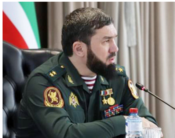
Председатель Правительства Чеченской Республики, Герой России Магомед Даудов провел совещание с членами кабинета

министров по вопросам развития социальной сферы региона.