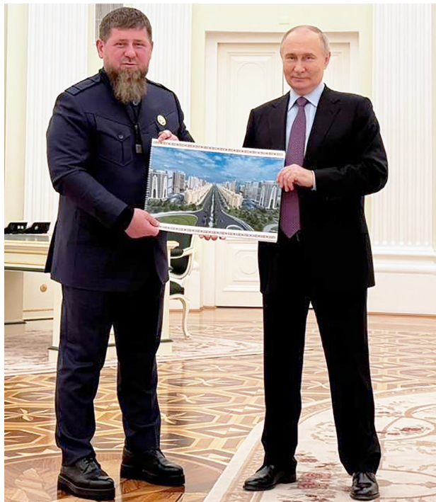
Глава Чеченской Республики Рамзан Кадыров накануне вечером встретился с Владимиром Путиным в

Кремле, пригласил Президента России в Чечню и поблагодарил его за поддержку.